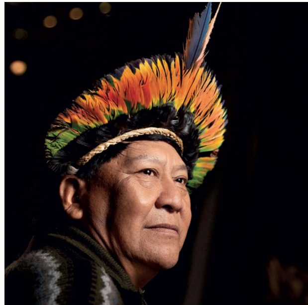
DAVI KOPENAWA, LEADER AUTOCHTONE