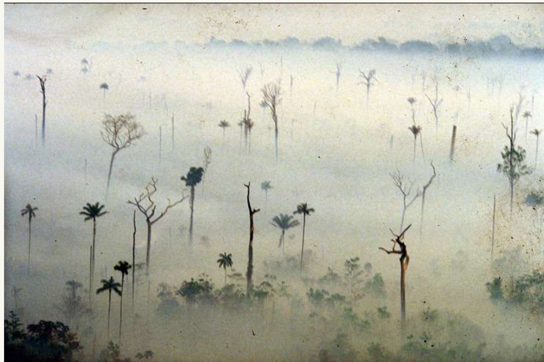
Frans Krajcberg, déforestation en Amazonie brésilienne, circ.1980

Le Centre d'art organise ainsi des expositions hors les murs , ou dans notre espace temporaire, afin d'approfondir le travail de transmission du message de l'artiste en élargissant les publics.